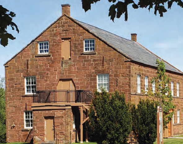
Musée de la Banque des fermiers de Rustico.