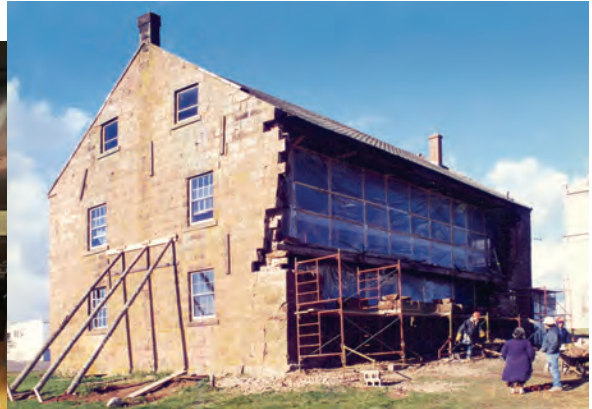
Restoration de la salle paroissiale de Rustico. ▲ (Musée de la Banque des fermiers de Rustico).