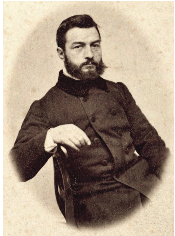
Edme Rameau de Saint-Père. ▲

L'intérêt d'Edme Rameau envers les Acadiens ne se limite pas à leur histoire. Il souhaite également les aider à conserver leur identité, donc à vivre et à survivre en tant que francophones dans un milieu en majorité anglophone. Il maintient une correspondance avec plusieurs meneurs de la communauté acadienne des Maritimes, leur offrant des conseils et même de l'aide financière pour assurer leur développement social et économique. Il écrit dans son livre La France aux Colonies :