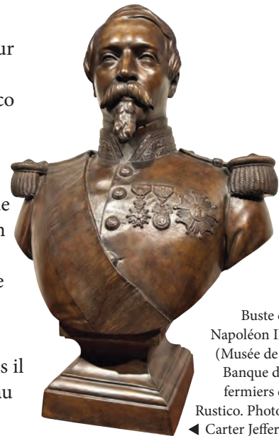
Buste de Napoléon III. (Musée de la Banque des fermiers de Rustico.)